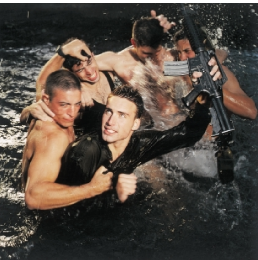
ללא כותרת, 1999

במהותם תצלומי האופנה של נס הם בבחינת המחשה מילולית של רעיון הפאנאופטיקון של פוקו, הדימוי הסימבולי שלו למשטר שליטה המשמר את כוחו עליידי כך שהוא נותר בלתי נראה תוך שהוא מקיים פיקוח מרבי 4 . בדימויו המבוים בקפידה מאלץ נס את הבלתי נראה להיחשף, ומניב היפוך ויזואלי המאפשר ללכוד את מה שעל פניו נותר סמוי מן העין. האופנה משמשת כמשל לדרכים שבהן ניסיונותינו לרכוש שליטה עשויים לשכנע אותנו ליטול חלק במעשי הכפייה המוקעים עליידי הנחות תרבותיות. אנו נושאים את עינינו אל הדימויים הנוצצים של תעשיית האופנה כדי שינהירו לנו כיצד להיראות נחשקים, ונכנעים לתכתיבי תרבות הצריכה במקום