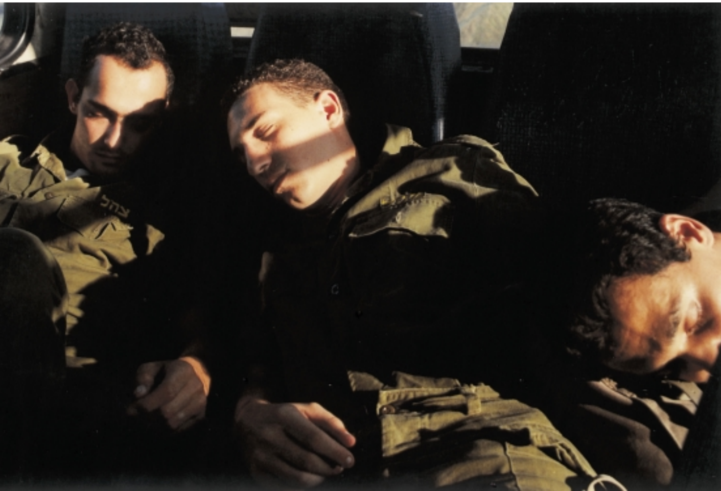
ללא כותרת, 1999

המילים האופייני שלה מוצגים במפורש בהעמדה המחושבת של השחקנים ובמשחקי האור והצל האינטנסיביים על פני שטח גופם (קט. 2). בדומה לרטוריקה של תצלום הסטיל הקולנועי, נס מבקש לייצר סינקדוכה, אירוע רגעי אחד ויחיד הטומן בחובו את הנרטיב הגדול. מכיוון שהנרטיב הנו מבנה רטורי המאורגן סביב הנהייה לעבר הסיום הרצוי, הרי חשוב לשאול מהו היעד שמבקש נס להשיג באמצעות נרטיבים ויזואליים אלו. נס חותר תחת אושיותיה של טריטוריה שצלמים בני זמננו דוגמת רוברט מייפלט'ורפ, סינדי שרמן וג' וול הפכוה למוכרת; צלמים שכולם משתמשים באוצר מילים של ספקטקל ויזואלי השאוב מן הקולנוע, ומתערבים בדחף הנרטיבי של התצלום על-ידי הסטת מסקנה מתבקשת לשטח לא מוכר. במעגל המשמוע המתקבל חווים הצופים תרחישים טורדניים שאינם משקפים עוד את ציפיותיהם, ובכך מאלצים אותם להתמודד עם הפער שבין פנטזיה למציאות. ספקטקלים צילומיים מעין אלו מסבים את תשומת הלב לתחבולה המזמנת את מעורבות הצופה בדימוי.