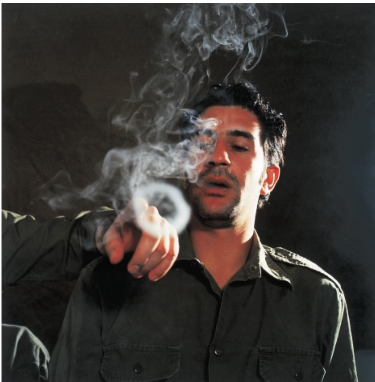
ללא כותרת, 1994

הקשר הכלא מרמז כי הקצין והנער עסוקים במפגן ביצועים הדדי, בעוד שההקשר של תת התרבות ההומוסקסואלית מסיט את הדימוי אל המשלב הלוהט יותר של ציפייה מינית, או אולי אפילו להט התשוקה להיות נשלט. שניות זו יוצרת מעידה רטורית ומעודדת את הצופה לתהות אילו פשעים כנגד הסדר הקיים מוצגים בתצלומים אלו: האם מושאי התצלומים ביצעו פשעים פוליטיים כנגד המדינה או ביצעו פשעים חברתיים כנגד ההטרוסקסואליות? ושם אינו עדים אלא לפשעים בנאליים כנגד משטר האופנה המתרחשים כאשר גברים שאינם דוגמנים עוטים על גופם בגדי מעצבים? בסופו של דבר, הצופה אינו יכול שלא לתהות כיצד ההנחות התומכות בספירות